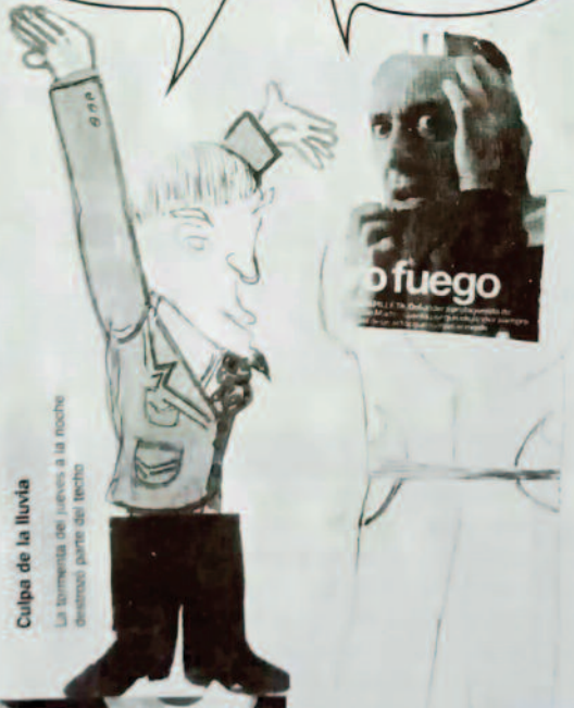
Culpa de la lluvia La tormenta de jueros a la noche desmenuó parte del techo